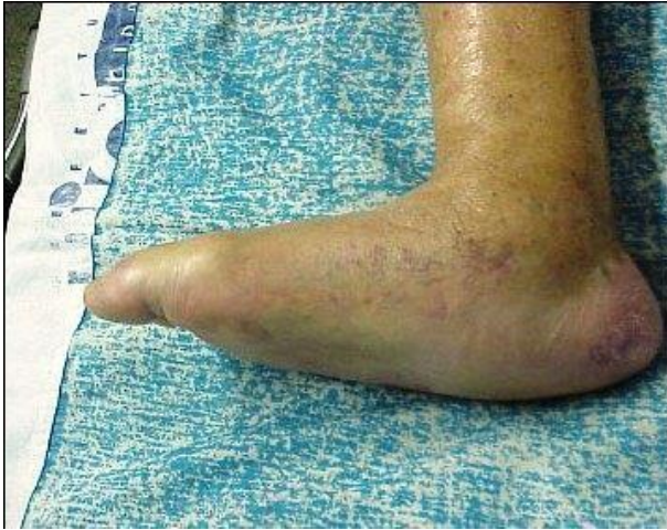
Figura 1: Pé de Charcot fase aguda.

hipertermia e às vezes dor, sendo muito importante fazer o diagnóstico. Já na fase crônica deformidades osteoarticulares importantes, leva ao desenvolvimento de calos e úlceras plantares (SILVA et al. , 2014) b .