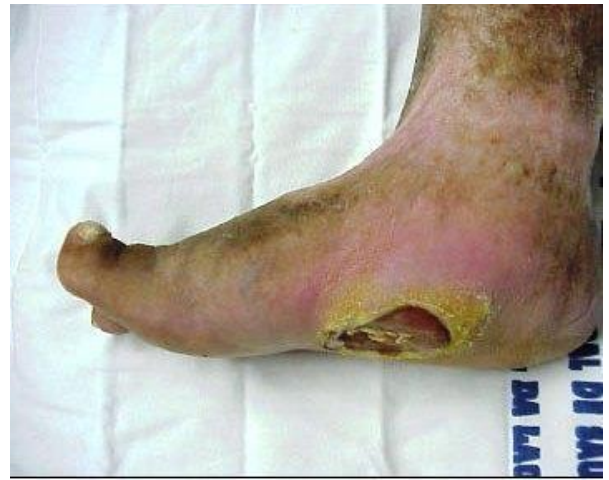
Figura 2: Pé de Charcot fase crônica

As lesões do pé diabético podem ser classificadas em uma graduação específica, segundo a classificação de Meggit e Wagner (1981), considerando seis graus ordenados conforme a evolução. A figura abaixo apresenta os graus e as características do pé diabético (ALVIM, 2017).